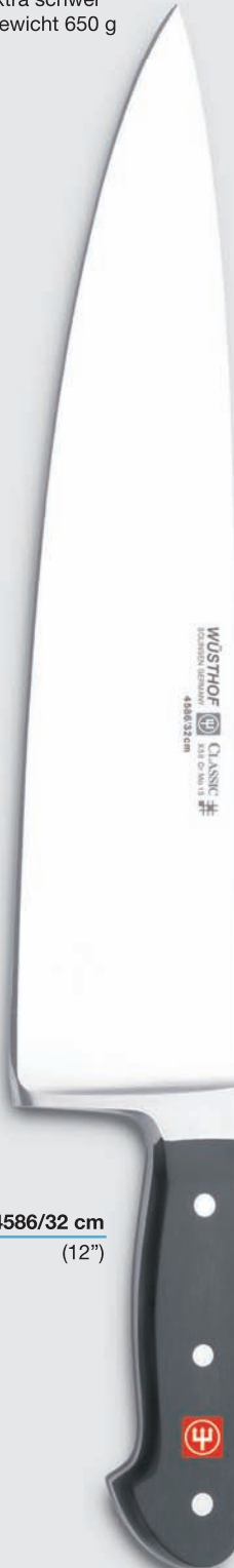
4586/32 cm (12")