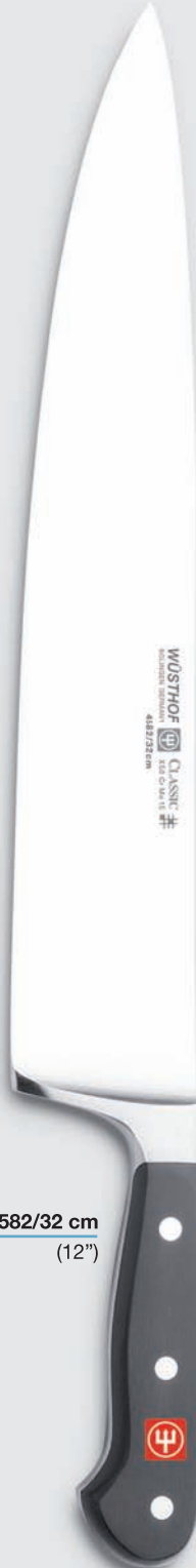
4582/32 cm (12")

cook's knife couteau de chef cuchillo de cocinero coltello cuoco