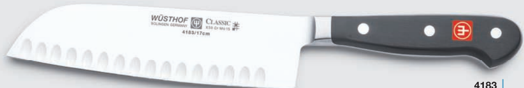
mit Kullenschliff with hollow edge