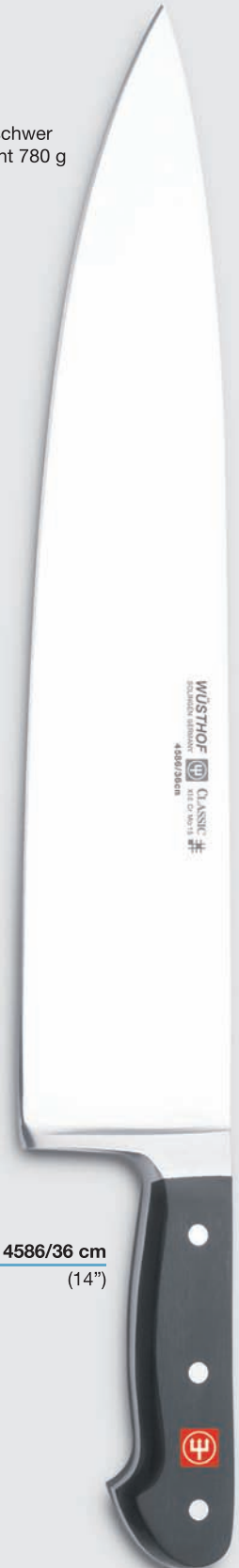
4586/36 cm (14")